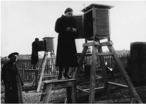
თსუ მეტეოროლოგიური სადგური ძველად